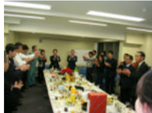
上棟祝いをしました