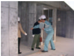
現場見学会の様子

11/22(土)、12/23(火)に管理の検討会を行いました。 11/22(土)の検討会後には、建物内見学、そして上棟祝いをしました。