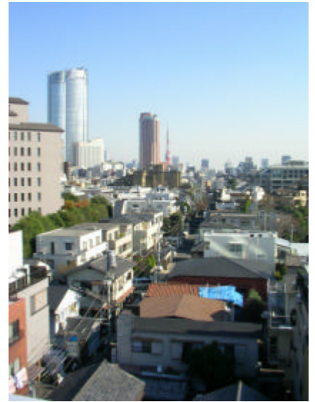
計画地からは六本木ヒルズと東京タワーが見える