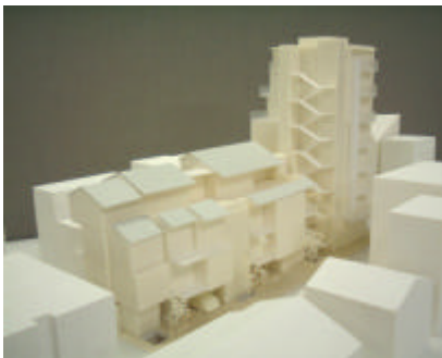
計画建物の模型写真

小委員会は、地権者の皆さんが、「住みつづけられ、商売をつづけられること」を基本的な課題とし、地権者の皆さんへのコンセプト提案「苞舎(ほうしゃ)」、事業手法提案「共同建替えのすすめ」などを作成して話し合いを行ってきました。