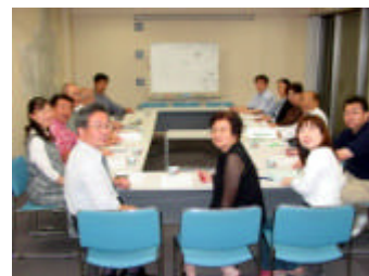
実行委員会での記念撮影

当日は肌寒く、いつ雨が降ってもおかしくない空模様の中、KTハウスにお住まいの方を中心にたくさんの方々にお手伝いいただき、計106名の参加がありました。ここでは、交流会終了後にいただいた皆さんからの感想を掲載させていただきます。