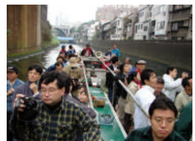
みなさんどこを見ているの？

「神田を歩こう」は年2回、春と秋の開催で、次回は来年の春頃を予定しております。スケジュールと内容が決まり次第ご案内しますので、是非ご参加下さい。(としまち研 横山朋紀)