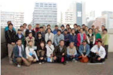
出発前の記念撮影

去る10月22日(土)に「神田に住もう会」の企画である、第4回「神田を歩こう」を開催しました。