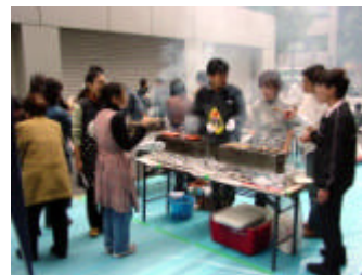
お手伝いありがとうございます

須田町二丁目町会には、焼鳥器や鉄板等、たくさんの器材をお借りしました。ありがとうございます。