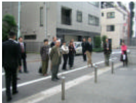
外壁の色を外で検討中

10月より工事を着工し、順調に進んでいます。現在は、共用部と管理の検討会を行っています。