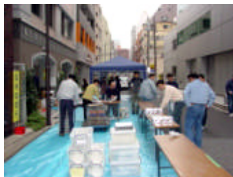
当日朝の準備風景

今回の交流会は、神田にあるCOMS HOUSE(東松下町) 桜ハウス(東松下町) クレアル神田(須田町) KTハウス(司町)(仮称)コーポラティブハウス西神田(西神田)の入居者・入居予定者で 居住者同士の交流を図る。 交流会の開催される町会の皆さん(所有・賃貸を問わずマンシ